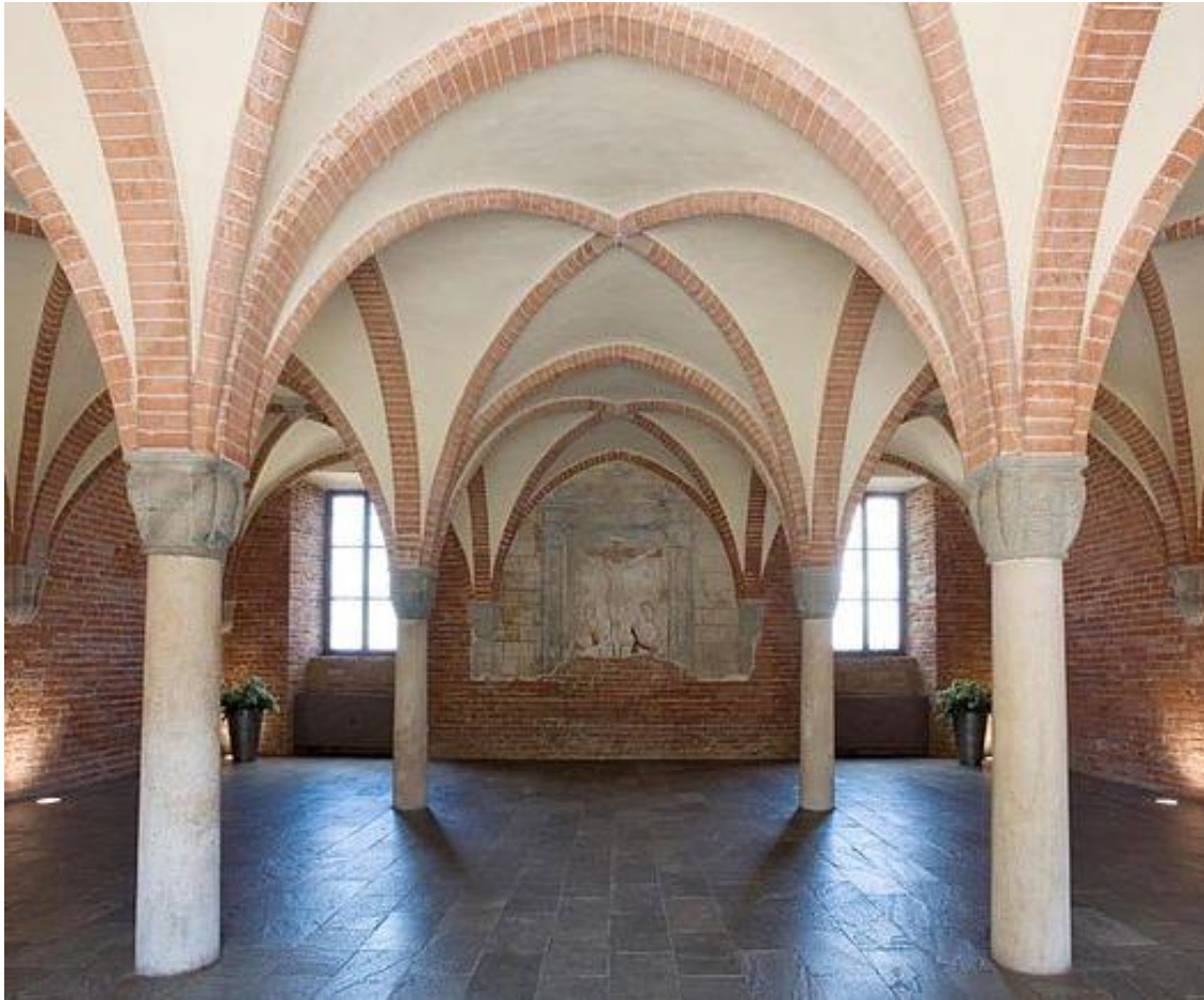
16 Marzo 2024 Principato di Lucedio, Trino Vercellese (VC)

Al seminario, che si è tenuto nell'affascinante abbazia medioevale del Principato di Lucedio, erano presenti tutti i Presidenti di club Rotary e Rotaract del nuovo anno rotariano, i 12 Assistenti del Governatore e lo staff distrettuale 2024-2025.