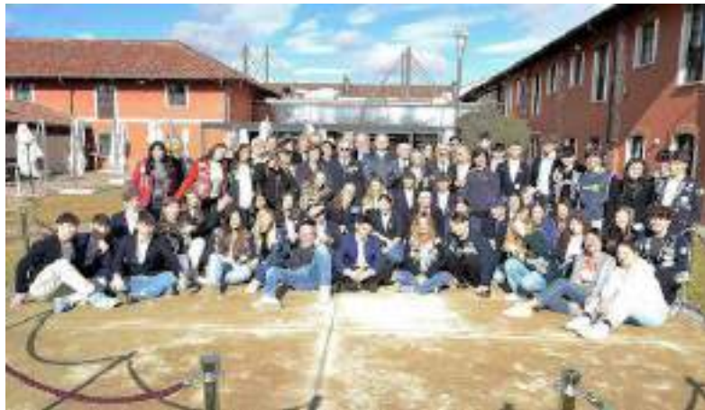
Domenica 11 febbraio 2024 Pinerolo

Il programma Rotary Youth Exchange è un incredibile moltiplicatore di contatti, esperienze ed emozioni. Domenica 11 febbraio a Pinerolo è iniziata la fase formativa per 22, tra ragazze e ragazzi, che si apprestano a partire per vivere un intero anno all'estero presso altrettante famiglie. Un anno dove studieranno, visiteranno luoghi meravigliosi, faranno amicizie e impareranno la lingua del posto.