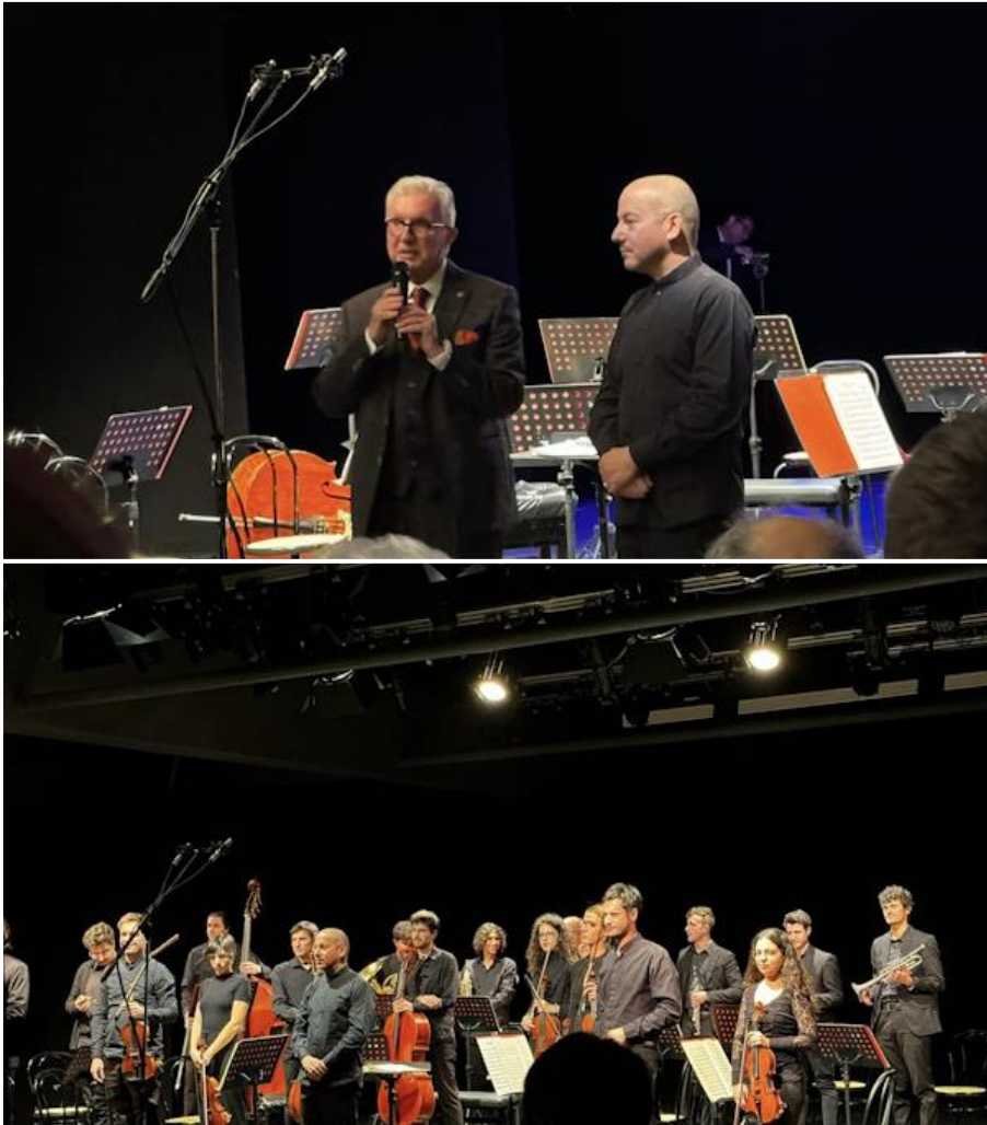
Martedì 5 dicembre 2023 Teatro Vittoria - Torino

Il concerto natalizio del Rotary Distretto 2031, tenutosi martedì 5 dicembre presso il Teatro Vittoria a Torino, questo anno è stato affidato all'Orchestra da Camera G. B. Polledro.