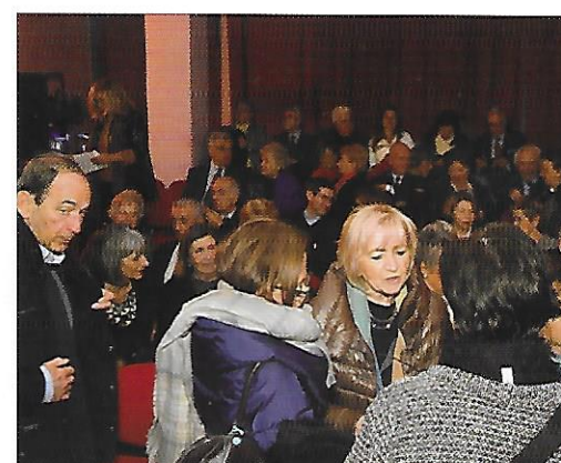
Il pubblico in sala