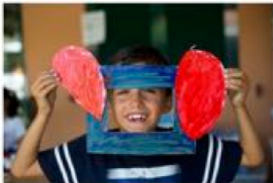
Area prevenzione e tutela