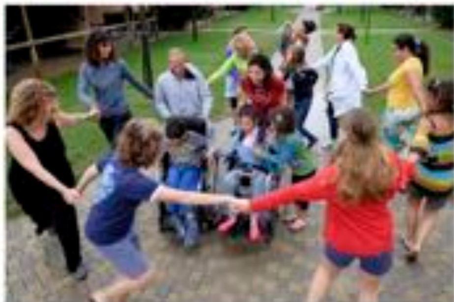
Area disabilità e famiglia